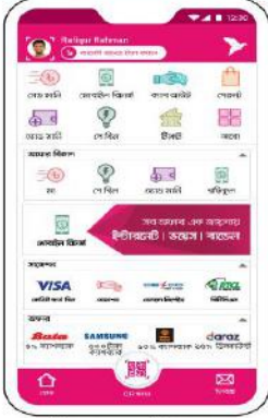
বিকাশ অ্যাপ স্ক্রিন থেকে পে বিল সিলেক্ট করুন