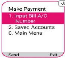
"1" লিখে সেভ করুন