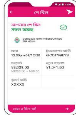
'পে বিল' সম্পন্ন হলে কনফার্মেশন পাবেন