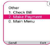
Make Payment বেছে নিতে "2" লিখে সেভ করুন