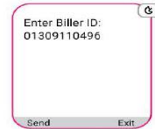
গুরুদয়াল সরকারী কলেজের বিকাশ একাউন্ট নাথার লিখে সেভ করুন