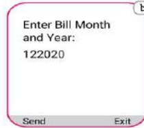
বিল মাস ও বছর টাইপ করুন