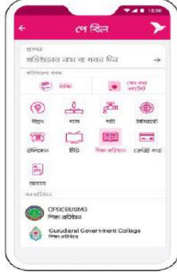
শিক্ষা প্রতিষ্ঠান ট্যাগ করে Gurudayal Government College সিলেক্ট করুন