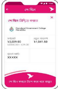
'পে বিল' সম্পন্ন করতে স্ক্রিনের নিচের অংশ ট্যাগ করে ধরে রাখুন