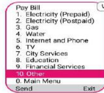
Other বেছে নিতে "10" লিখে সেভ করুন