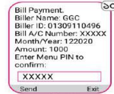
গোপন পিন (PIN) নাথার দিন

বিল পেমেণ্ট সম্পন্ন হলে কনফার্মেশন নোটিফিকেশন পাবেন