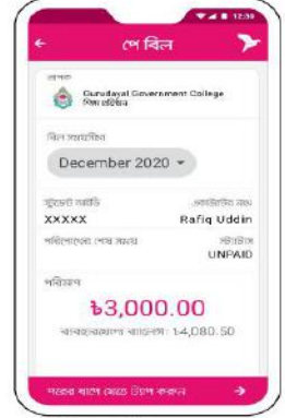
ফি-এর পরিমাণ চেক করে পরের স্ক্রিনে যেতে ট্যাগ করুন