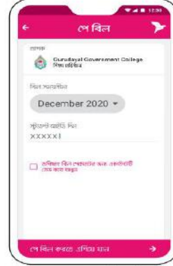
বর্তমান মাস এবং স্টুডেন্ট আইডি নাথার দিন। পরবর্তী ফি পেমেণ্টের জন্য একাউন্টটি সেভ করে রাখতে পারেন।