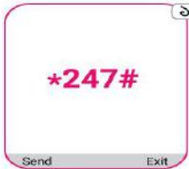
*247# ডায়াল করুন