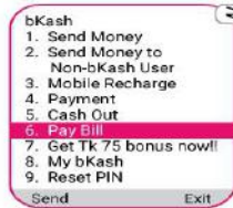
Pay Bill বেছে নিতে "6" লিখে সেভ করুন