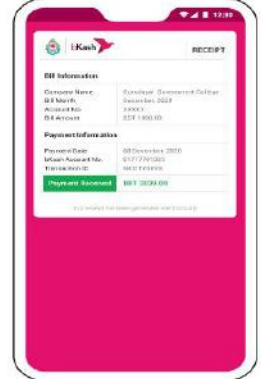
অ্যাপে দেখে নিতে পারেন বিলের ডিজিটাল রিসিট