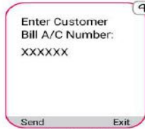
স্টুডেন্ট আইডি টাইপ করুন